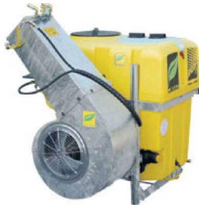
Atomizzatore a cannone

Codici identificativi degli ugelli: sigle alfanumeriche che descrivono le caratteristiche dell'ugello; secondo le norme internazionali ISO il loro significato è associato al colore: ad esempio, il codice 11002 (colore giallo) significa angolo di spruzzo 110°, portata di 0.8 l/min a 3 bar. Nei vecchi ugelli a cono con piastrina e convogliatore le dimensioni sono espresse indicando il diametro di tali elementi; ad esempio 1,8/1,2 (foro piastrina 1,8 mm, foro convogliatore 1,2 mm) oppure 1,5/- (foro piastrina 1,5 mm, convogliatore cieco).