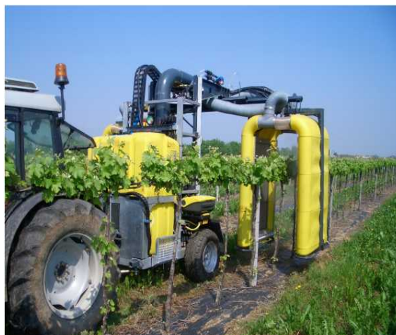
Irroratrice a tunnel

Irroratrice a recupero o tunnel : irroratrice dotata di pannelli per il recupero del liquido non trattenuto dalla vegetazione; è in grado di abbattere quasi completamente la deriva e di recuperare mediamente circa il 40% della miscela antiparassitaria distribuita